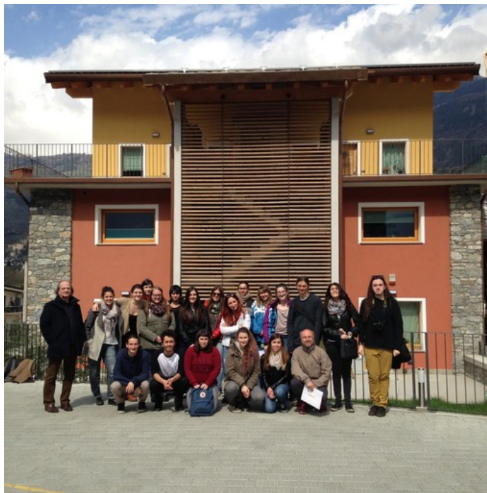
La V B del Liceo Artistico davanti alla Maison d'Antoine

A domani Auto&Dintorni Bonjour Valdotains Chez Nous Confcommercio VdA