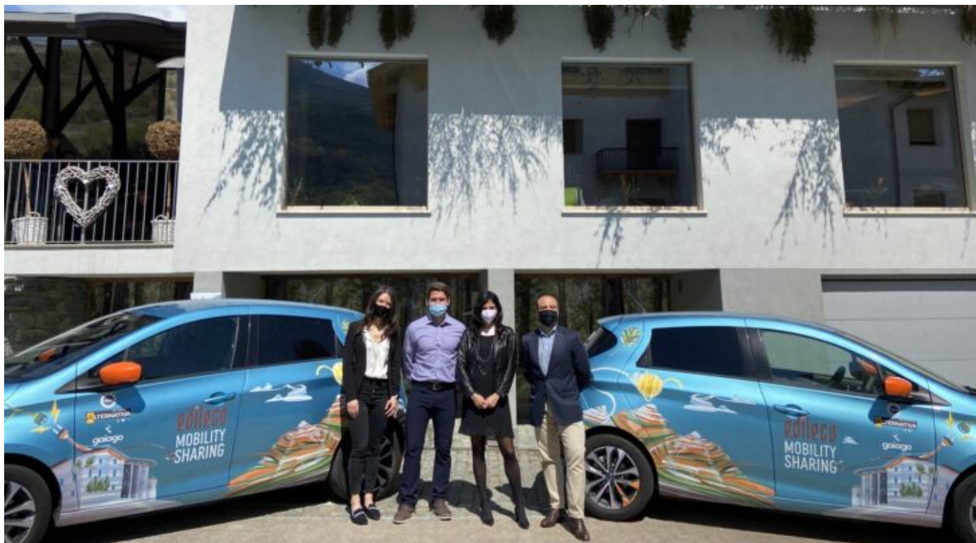
Edileco Mobility Sharing

Auto elettriche in Valle d'aosta? Edileco Mobility Sharing porta una ventata d'aria pulita sul territorio valdostano. Per ora sono due le auto elettriche messe a disposizione dal servizio battezzate Nona ed Emilius , un tributo a due delle vette visibili dal capoluogo. Il progetto è in fase di sperimentazione già da 2 mesi, a partire da oggi però il servizio verrà esteso a tutti i 70 dipendenti di Edileco. A collaborare al progetto ci sono anche Sicav 2000 per la messa a disposizione dei veicoli, e della relativa assistenza, Gaigo per la piattaforma digitale di carsharing ed EcoFuture Lab , per l'integrazione tra ricerca e azienda.